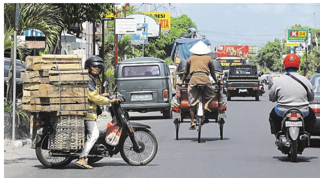
Země v pohybu. V Indonésii se mísí modernita se staletými tradicemi, jako třeba v kulturním centru celé Jávy – ve městě Jogjakarta.

Proč tak učinit? „Indonésie je moderní prosperující země s ekonomickým potenciálem a je na vzestupu,“ říká Budiman, která vyučuje především jazyk bahasa indonesia. Studenti budou mít ja-